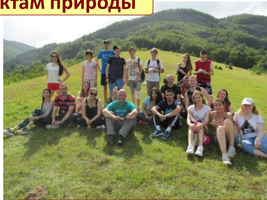
НА ВЫСОТЕ 1000 М В РАЙОНЕ дер.БЛАЖЕВО