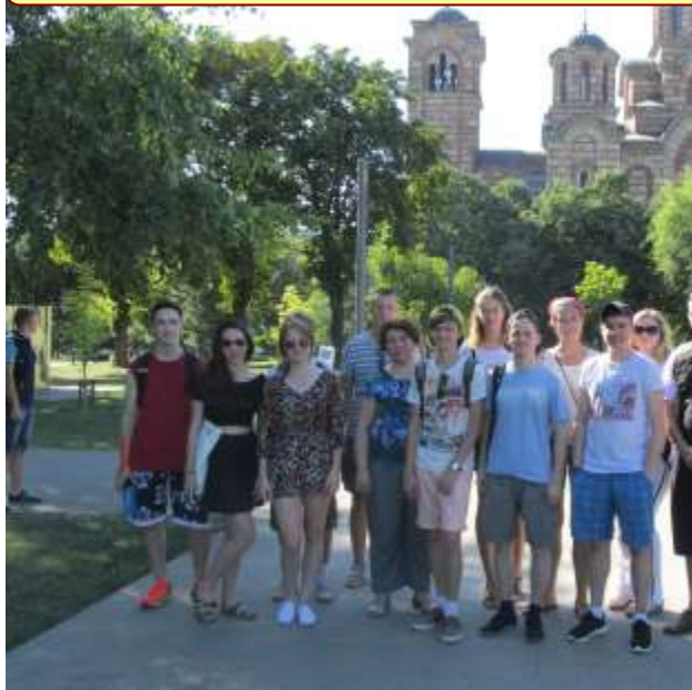
ПАРК ТАШМАЙДАН И ХРАМ СВЯТ