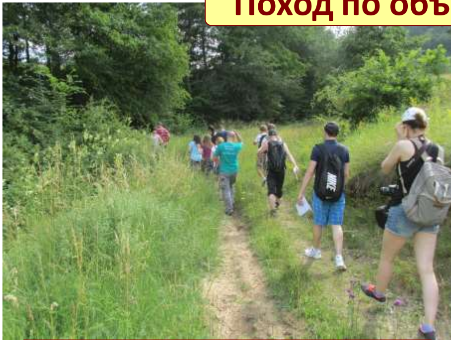
МАРШРУТ В ОКРЕСТНОСТЯХ дер.БЛАЖЕВО