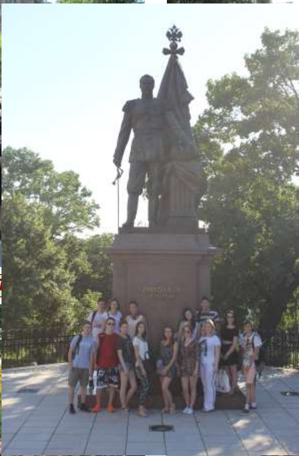
У ПАМЯТНИКА НИКОЛАЮ II