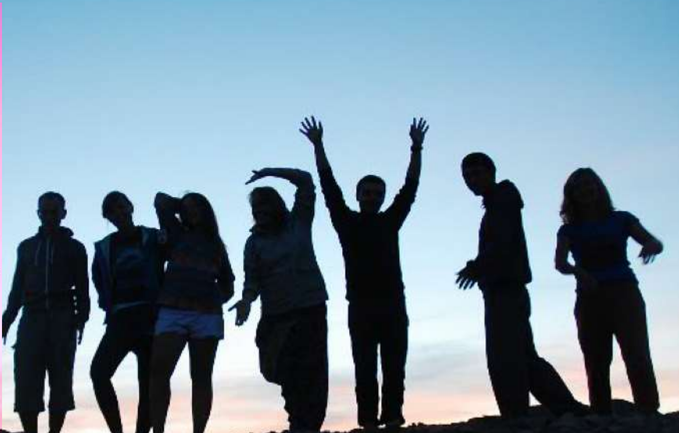
Вечер в горах!!!