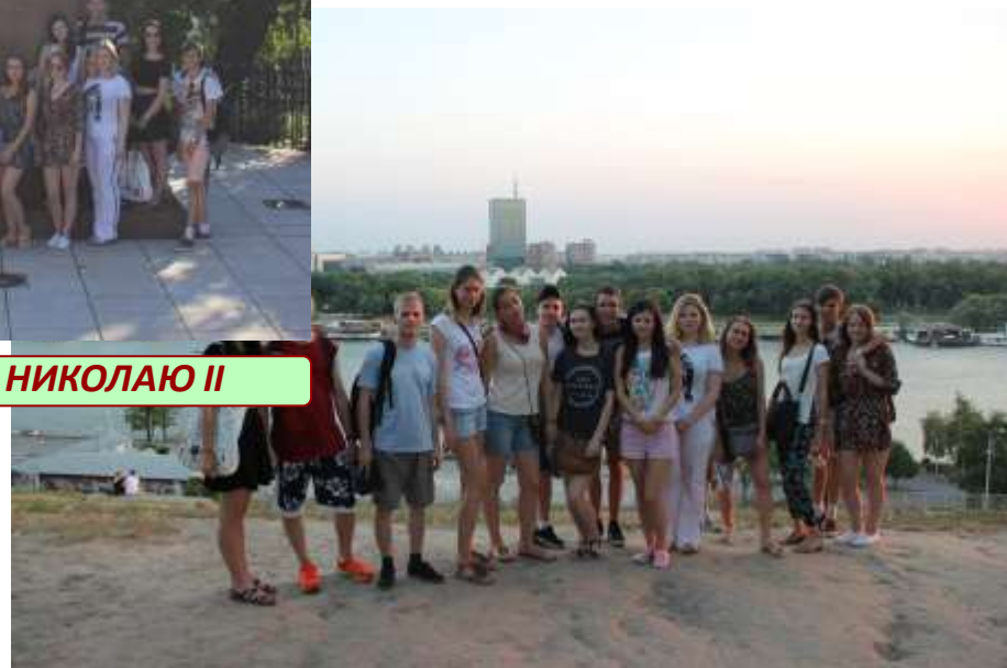
НА БЕРЕГУ р.САВА