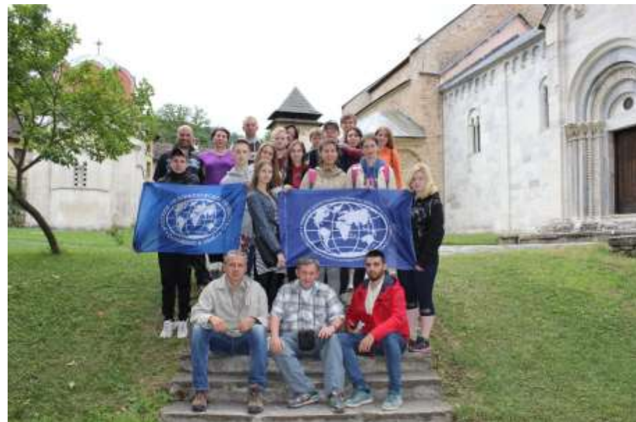
НА ТЕРРИТОРИИ МОНАСТЫРЯ СТУДЕНИЦА