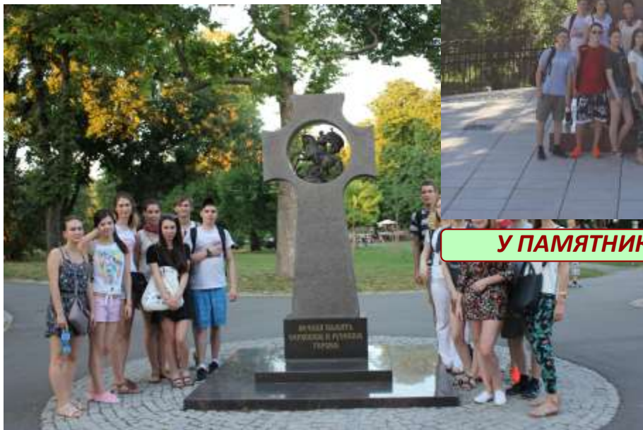
У ПАМЯТНИКА ГЕРОЕВ