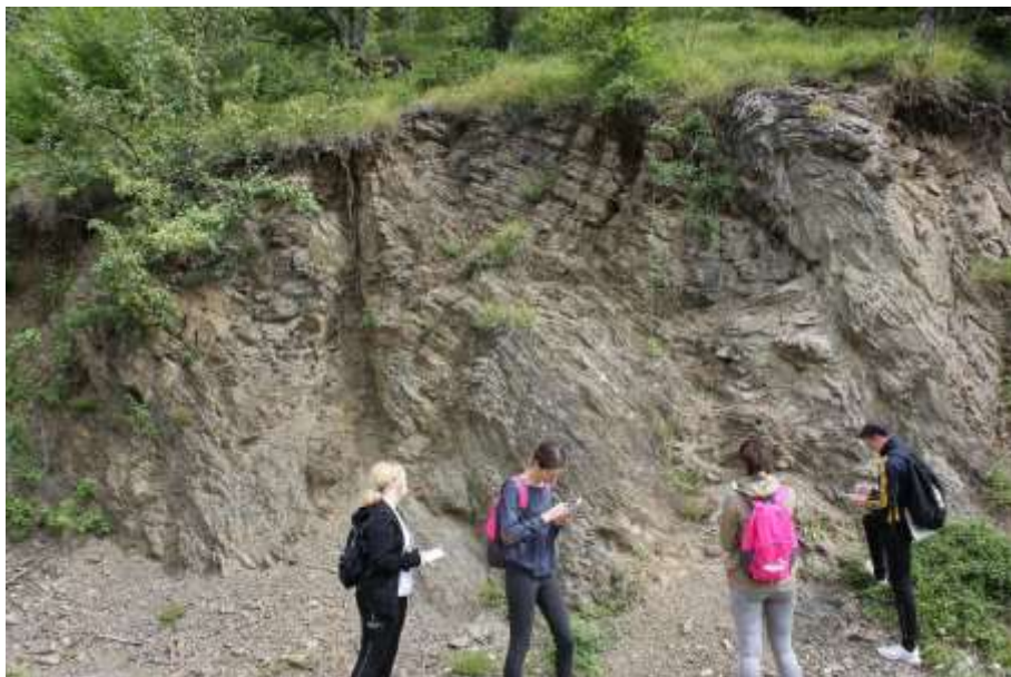
СКЛАДЧАТОСТЬ ПОРОД НА МАССИВЕ КОПАОНИК